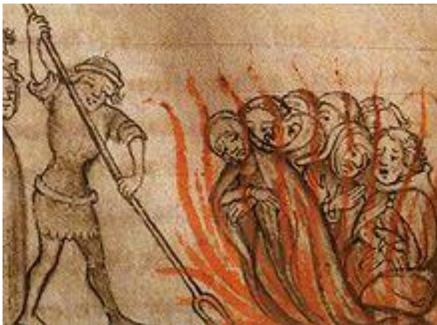
Tempeliers tot die brandstapel veroordeel

Dieselfde lot het die Orde van die Tempeliers in 1312 getref toe pous Clemens op aandrang van die koning, Philippe le Bel, die orde opgehef het. Die skatte van die Tempelridders het die skatkis van Philippe le Bel gevul en hom van ’n dreigende bankrotskap gered. Pous Clemens was toe al van 1309 in Avignon. Dit was die tyd van die dubbele pousdom en omdat die Vlaminge nie die “Franse” pous van Avignon wou erken nie aangesien hy die speelbal van die koning was en hulle sy leer in 1302 by Kortyk tydens ’n opstand verslaan het, het hulle toe en tot vandag toe steeds gepraat van die “pous van Rome”. Hulle het hom gekies omdat hy in ’n stryd met die Franse koning verwickel was. Die verwysing na die pous van Rome was dus geen uiting van vrome gevoelens nie, maar ’n politieke stellingsname. 9