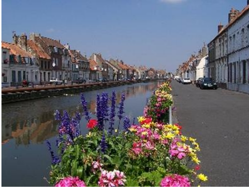
Aa-rivier in St Omaars

Die enigste “Frans” van een derde van die Kaapse Hugenote was die feit dat hulle Frans geken het en Pikardies gepraat het. Daar was seker ’n groot aantal wat Vlaams gepraat het soos byvoorbeeld diegene wat uit die huidige Vlaandere gekom het.