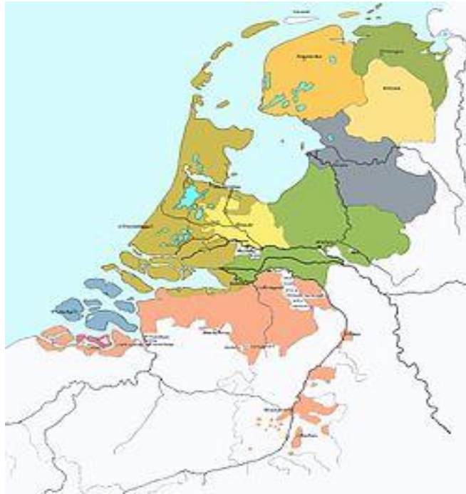
Kaart van die Nederlandse Republiek