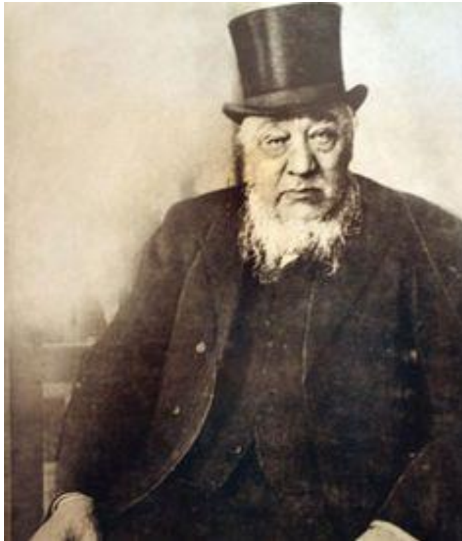
Pres. S.J.P. Kruger, Staatspresident van die Zuid-Afrikaansche Republiek

Dit was tydens sy verblyf alhier dat die tyding hom ook bereik het dat daar op 31 Mei 1902 by Vereeniging vrede gesluit was en dat die twee Republieke hul onafhanklikheid moet prysgee.