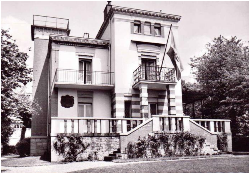
Vroeëre foto van Kruger-huis in Clarens, Switzerland

Op 9 Julie doen die President longontsteking op en is op 14 Julie in Clarens oorlede. Pres. Paul Kruger se stoflike oorskot is toe na Suid-Afrika gebring en op 16 Desember 1904 in Pretoria ter aarde bestel –'n groot staatsman en volksheld keer so terug na sy geliefde land.