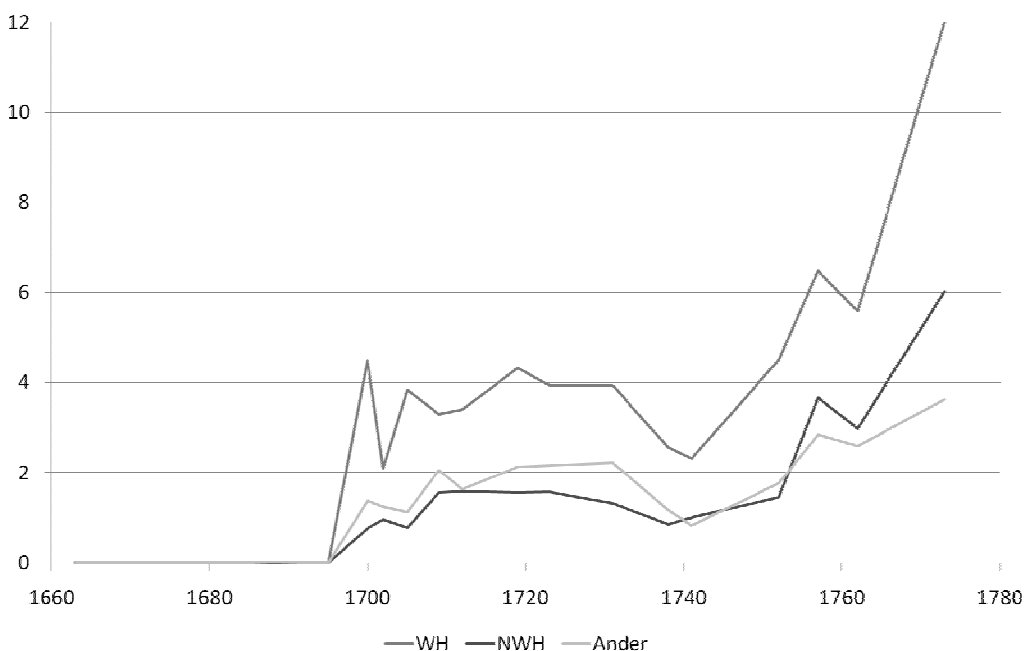
Figuur 3: Gemiddelde totale wynproduksie per huishouding, 1663-1773